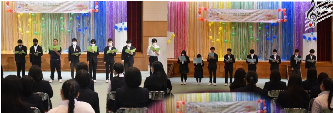
1学年の合唱の様子 & 2・3学年音楽選択生による合唱